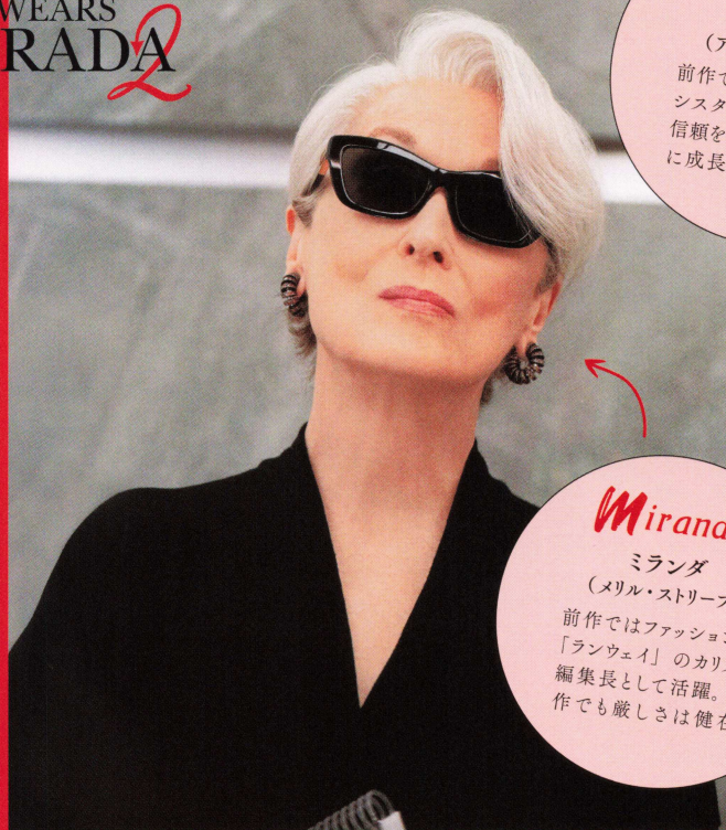
Miranda ミランダ (メル・ストリープ) 前作ではファッション誌「ランウェイ」のカリスマ編集長として活躍。本作でも厳しさは健在？

あのオリジナル・キャストが奇跡の再集結！ “私たちの物語” が、再び動き出す――。