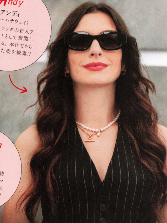
Andy アンディ (アン・ハサウェイ) 前作でミランダの新人アシスタントとして奮闘し信頼を得る。本作ですらに成長した姿を披露!?