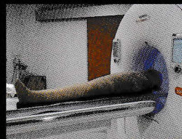
ミイラを最新型のCTスキャンにかけられる様子(2019年)

本展のためにCTスキャンしたミイラの研究成果を世界初公開します。また、ミイラ制作に使用されたカノボス壺の分析など、ライデン国立古代博物館が進める最先端の研究を紹介します。